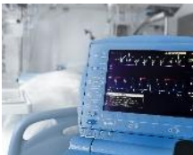
医疗 (检测、手术 器材)