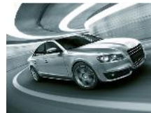
汽车 (感应器和连接器， 电池组材料)