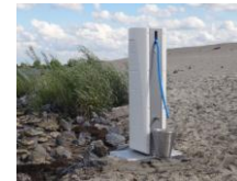
消费和工业领域 (流体工程)