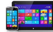
消费电子 (电磁屏蔽)